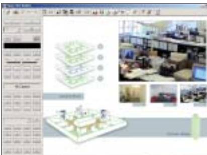
"Layout Editor": diseño personalizado