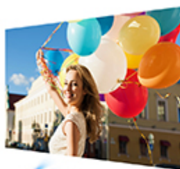
SuperColor™ projectors offer color accuracy levels