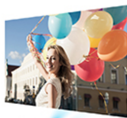
Conventional projectors offer low-quality images