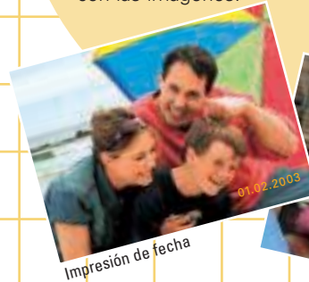
Impresión de fecha

Todas las funciones de la COOLPIX 3100 y COOLPIX 2100 se han diseñado pensando en la facilidad de uso y la diversión. Prueba la función de impresión de fecha de Nikon para que aparezca automáticamente la fecha en cada fotografía en el momento de hacerla. La función inteligente Recorte de fotografías permite recortar las imágenes cuando están aún en la cámara para conseguir siempre el resultado deseado. Además, con los filtros sepia, monocromo y halo, podrás ser aún más creativo con las imágenes.