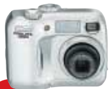
COOLPIX3100 3,2 Megapíxeles Efectivos