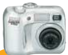
COOLPIX2100 2,0 Megapíxeles Efectivos