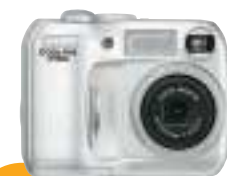
COOLPIX2100 2,0 Megapíxeles Efectivos