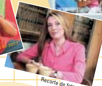
Recorte de fotografías