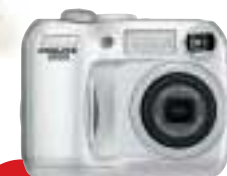
COOLPIX3100 3,2 Megapíxeles Efectivos