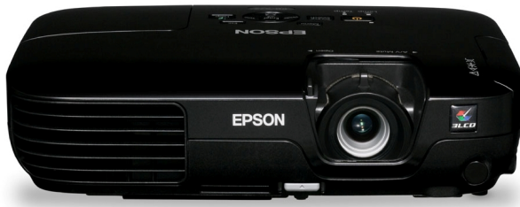
EB-S72 / EB-X72

La tecnología 3LCD ofrece una extraordinaria calidad de imagen con una reproducción del color uniforme y natural.