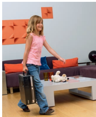
Ligero y fácil de llevar a cualquier parte