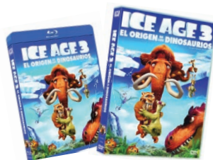
Ilustración sujeta a cambios