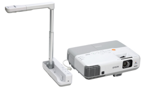
Comparte objetos en 3D con la cámara de documentos Epson ELP-DC06