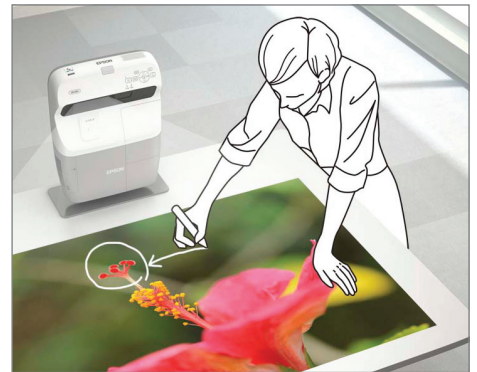
Proyecta sobre cualquier superficie horizontal, por ejemplo una mesa