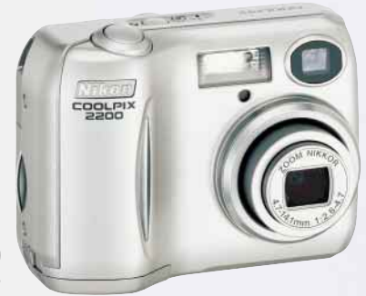
COOLPIX 2200 2,0 megapíxeles efectivos