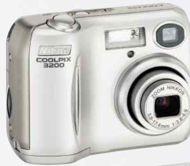
COOLPIX 3200 3,2 megapíxeles efectivos