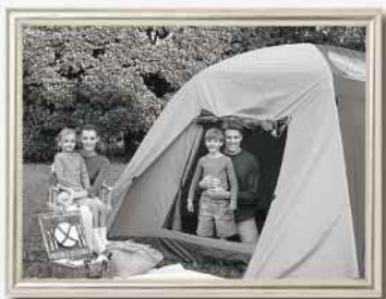
Blanco y negro