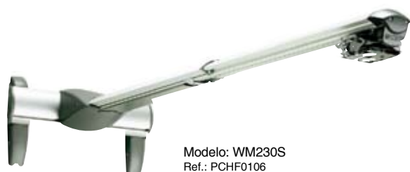
Modelo: WM230S Ref.: PCHF0106