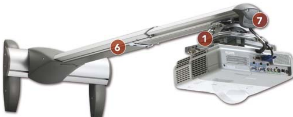
Modelo: WM230S Ref.: PCHF0106

Nuestra amplia gama de soportes de pared universales para proyectores de corto alcance proporcionan una flexibilidad, precisión y robustez inigualables. Garantizan instalaciones rápidas, seguras y con una precisa alineación.