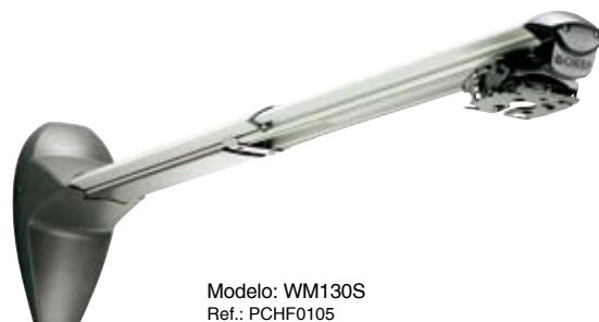
Modelo: WM130S Ref.: PCHF0105